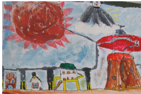
【児童生徒部門（絵画）】 「火山都市666」