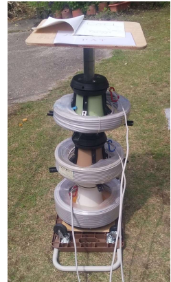
【一般部門】 「長尺物引出し装置 (ノータッチローラー)」

主 催 一般社団法人鹿児島県発明協会 共 催 鹿児島県・鹿児島県教育委員会・鹿児島県小中高等学校理科教育研究協議会 後 援 公益社団法人発明協会・鹿児島市・鹿児島市教育委員会 公益社団法人鹿児島県工業倶楽部・鹿児島商工会議所 鹿児島県商工会議所連合会・鹿児島県商工会連合会 NPO 法人まあちゃんのモノ作り育英会・南日本新聞社・MBC 南日本放送 NHK 鹿児島放送局・KTS 鹿児島テレビ・KYT 鹿児島読売テレビ・KKB 鹿児島放送