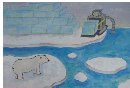
【冰山作成ロボット】 第69回鹿児島県発明くふう展 入選

・他入選1件【0円なんでも乾燥機】(表紙掲載作品) 第69回鹿児島県発明くふう展 知事賞