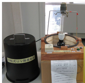
【回転式 UV 除菌装置】 第69回鹿児島県発明くふう展 (公社)発明協会会長奨励賞