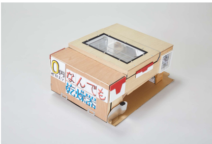
【児童生徒部門（発明考案）】 「0円なんでも乾燥機」