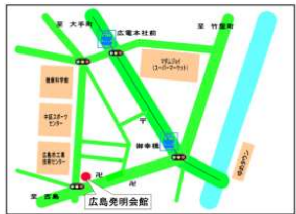
広島会場地図↑…広島電鉄「御幸橋」から徒歩3分 (JR広島駅より 系統① 広島港(宇品)行き)