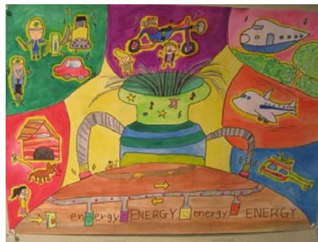
【児童生徒部門（絵画）】 「騒音吸収機」